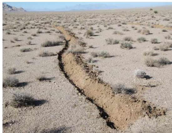
شکل ۳- احداث فارو در منطقه اجرای طرح