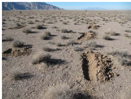
شکل ۵- احداث پیتینگ در منطقه اجرای طرح