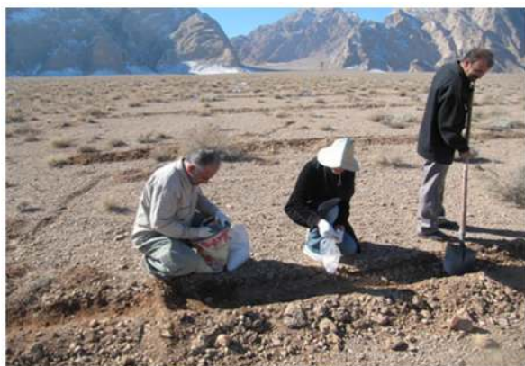
شکل ۶- کاشت بذر گونه Ferula tabasensis