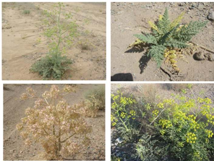
شکل ۱- گونه Ferula tabasensis در مراحل مختلف رشد

در تحقیقی شاخص‌های تنوع و غنای گونه‌ای در مراتعی که در آن عملیات مکانیکی اصلاحی هلالی‌های آبگیر انجام شده بود، در مراتع نارون شهرستان خاش استان سیستان و بلوچستان بررسی شد. نتایج نشان داد که کلیه شاخص‌های تنوع در منطقه اصلاحی با منطقه شاهد اختلاف معنی‌داری دارند، ولی بین شاخص‌های غنا در دو منطقه اختلاف