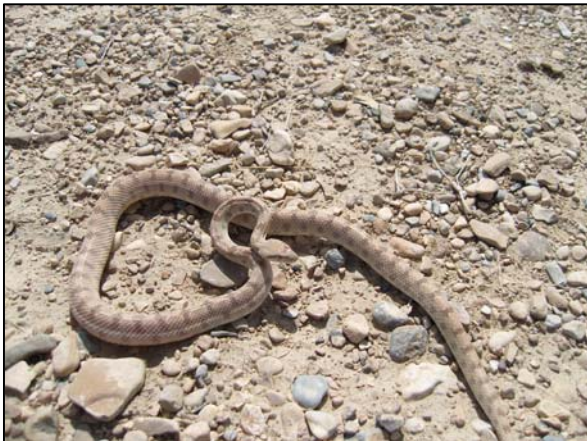
شکل ۵- Spalerosophis didema