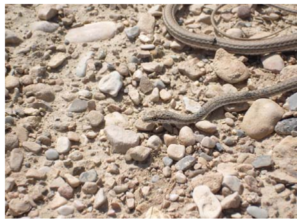
شکل ۶- Psammophis Schokari