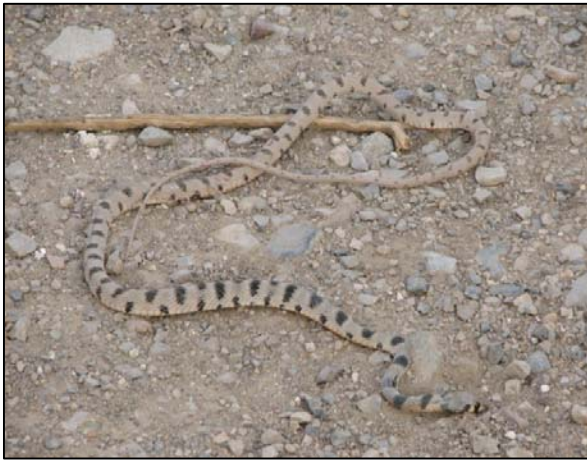
شکل ۳- Platycephalus Karelini