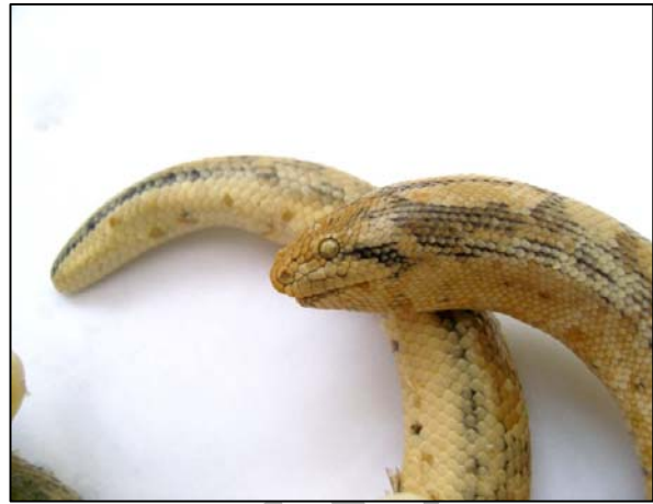
شکل ۲- Eryx jaculus