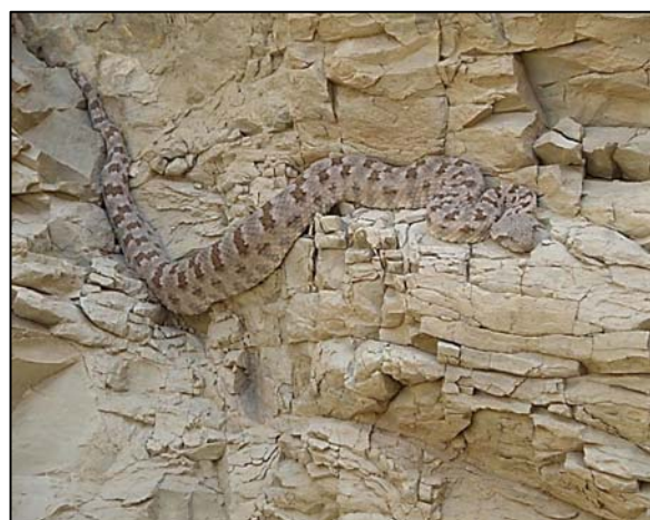
شکل ۸- Pseudocerastes Persicus