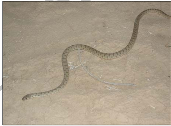
شکل ۴- Hemorrhois ravergieri