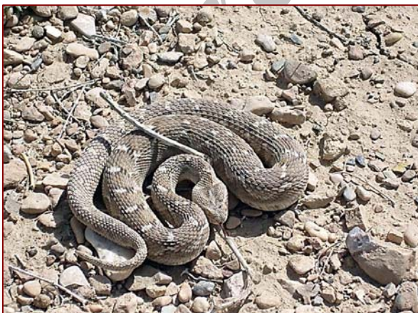
شکل ۷- Echis Carinatus