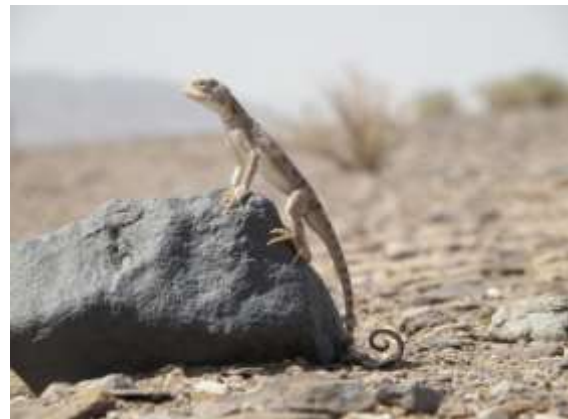
شکل ۲- Phrynocephalus maculatus