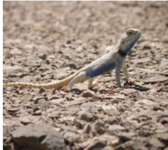
شکل ۴- Trapelus agilis