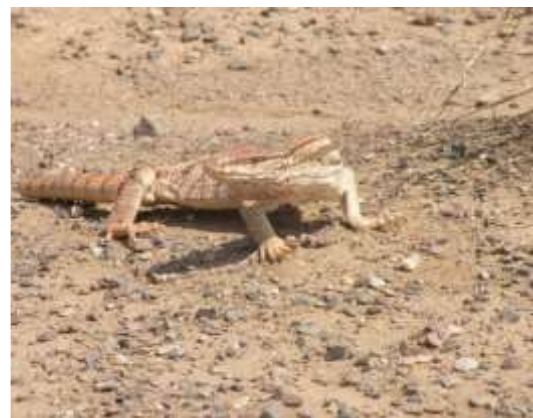
شکل ۱۴ - Varanus griseus