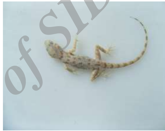
شکل ۶- Cyrtopodion scabrum