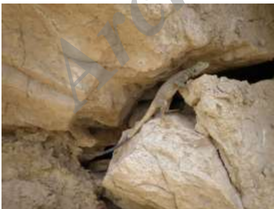
شکل ۱- Ladakia nupta