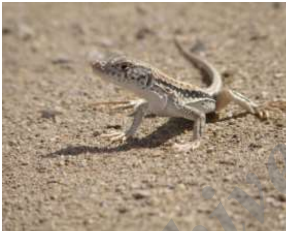
شکل ۱۱ - Eremias pesica