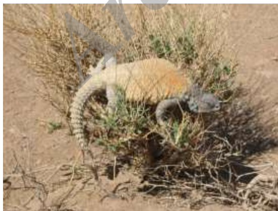
شکل ۱۳ - Saara asmussi