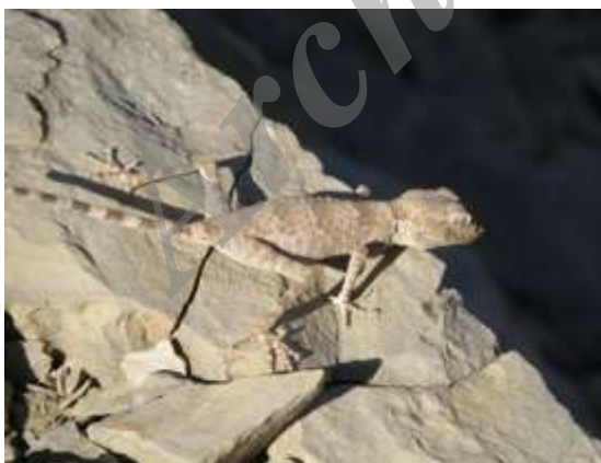
شکل ۷- Agamura persica