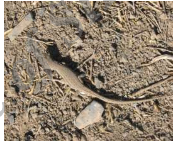
شکل ۱۲ - Mesalina watsonana