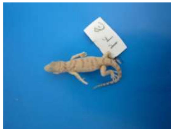
شکل ۸- Bunopus tuberculatus