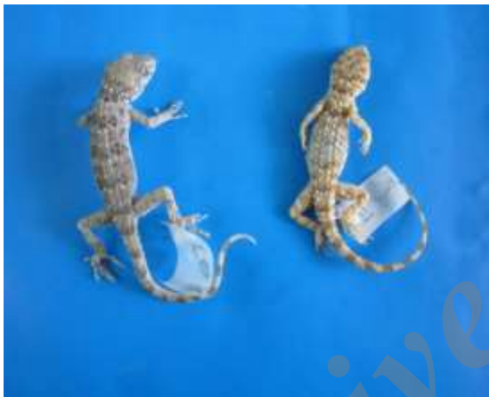
شکل ۵- Cyrtopodion caspium