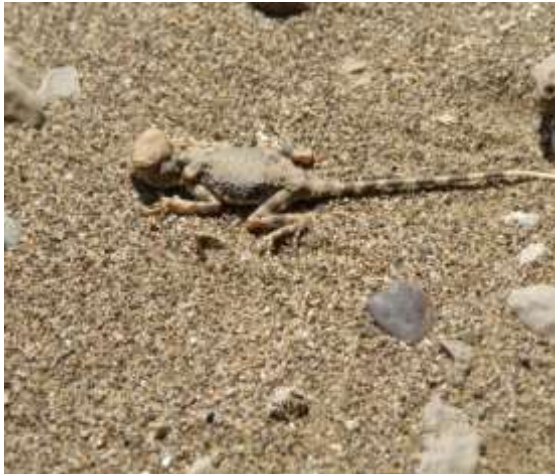
شکل ۳- Phrynocephalus scutellatus