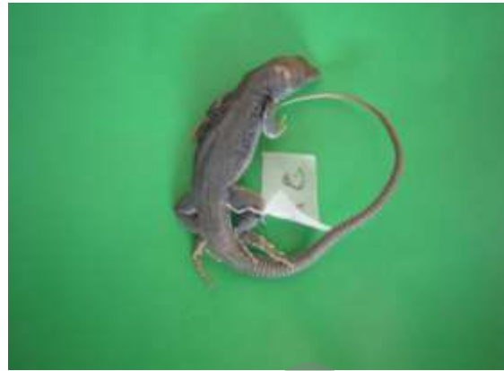
شکل ۱۰ - Eremias velox